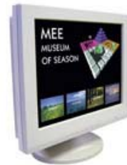
三菱電機エンジニアリング株式会社 タッチモニター