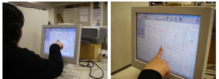
タッチモニター操作風景